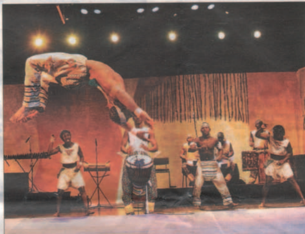
Le groupe Baobab Circus sur scène.

Comblent le vide L'Afrique subsaharienne est aujourd'hui très présente à Genève, que ce soit au travers des institutions internationales, des ressortissants établis dans le canton, des échoppes et des restaurants ou, bien sûr, des nombreux événements culturels. Cette ouverture s'observe également au sein des institutions musicales genevoises, qui ont inscrit la percussion africaine à leur programme... Pourtant, très rares sont les projets culturels musicaux d'envergure centrés sur l'Afrique noire. Un grand vide qu'il fallait à tout prix combler pour permettre aux événements africains de sortir du ghetto et de trouver un public dans le tout Genève. C'est pourquoi, sous l'impulsion de Djembé-Faré, association qui a pour but la promotion culturelle de la musique africaine en Suisse, nous avons mis sur pied