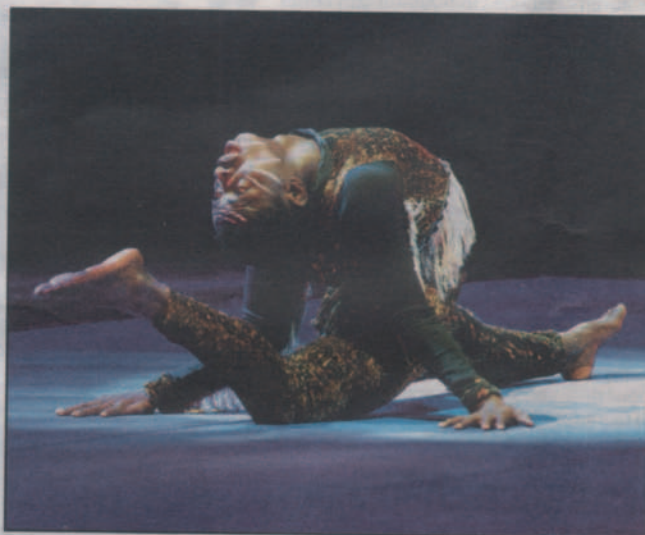
A l'Alhambra, le Circus Baobab présentera deux spectacles.