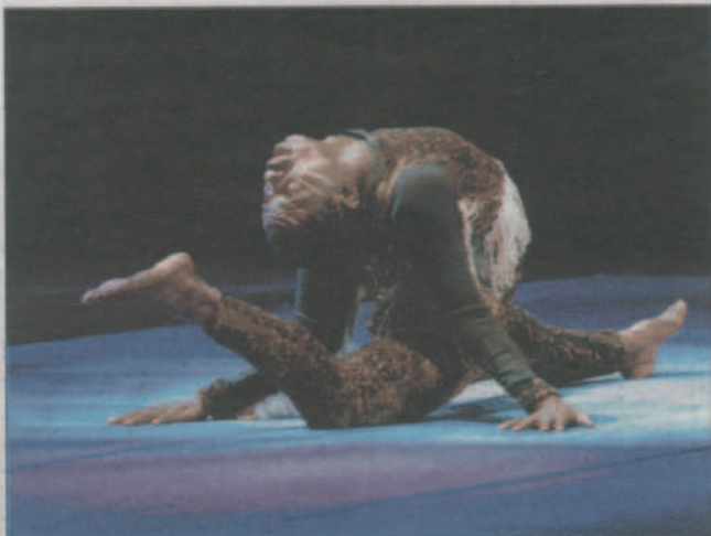
Circus Baobab. Vingt-cinq artistes de Guinée, acrobates, danseurs, comédiens et musiciens.